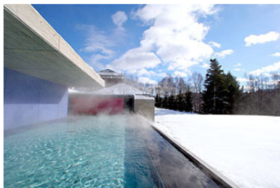
Kirin 木林の湯 露天風呂