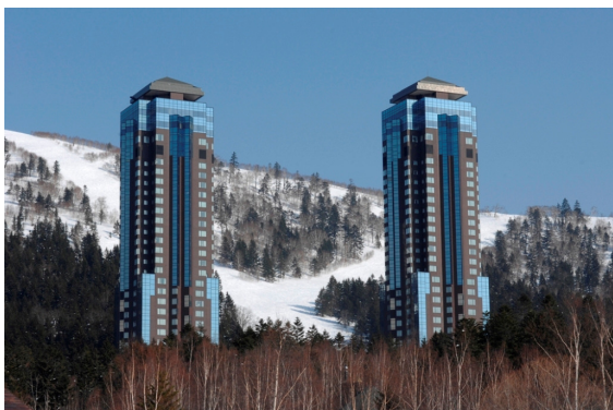
Galleria Tower Suite Exterior