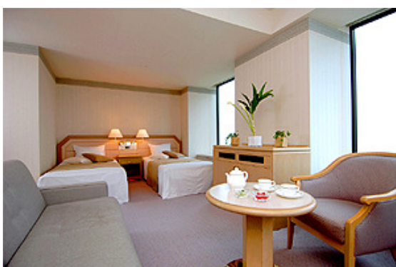
The Tower 客房