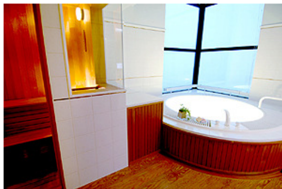
Galleria Tower Suite Hotel 套房內之按摩浴缸